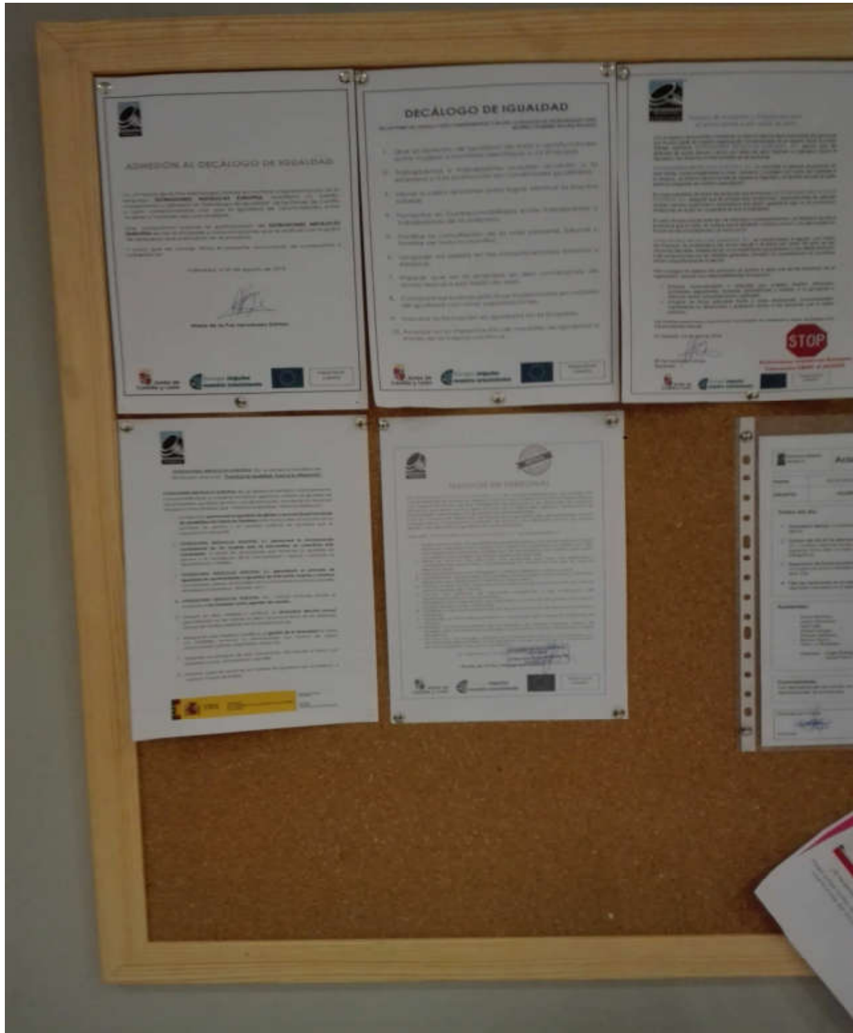
Tablón_2 de anuncios en lugar de paso del personal (vista general)